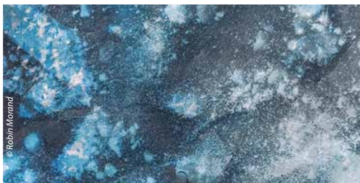
"In Situ" du 6 mars au 25 avril 2026 : peinture, photographie, installation de trois artistes sur le thème de l'eau.