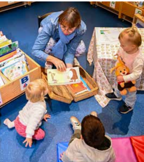
Accueil des tout-petits avec leurs assistantes maternelles.