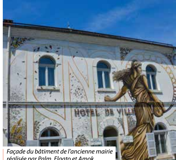
Façade du bâtiment de l'ancienne mairie réalisée par Palm, Elgato et Amok.