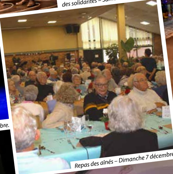
Repas des aînés – Dimanche 7 décembre.