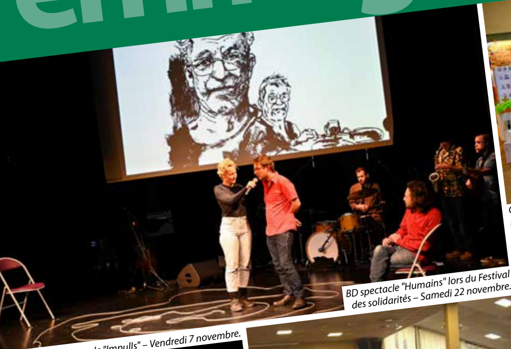
BD spectacle "Humains" lors du Festival des solidarités – Samedi 22 novembre.