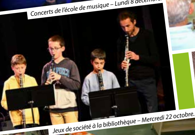
Jeux de société à la bibliothèque – Mercredi 22 octobre.