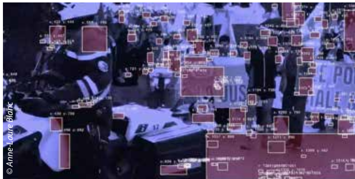
"Re-figurations" du 16 janvier au 14 février 2026 : une exposition collective issue du travail d'étudiants, en résonance avec les œuvres du musée des Beaux-Arts de Chambéry sur le mouvement de la Figuration Narrative.