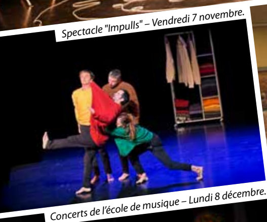
Spectacle "Impulls" – Vendredi 7 novembre.