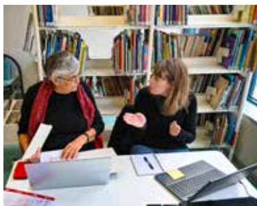
Lors des permanences numériques à la bibliothèque des deux mondes, une conseillère vous accueille sur rendez-vous, pour une séance d'une heure sur la thématique de votre choix.