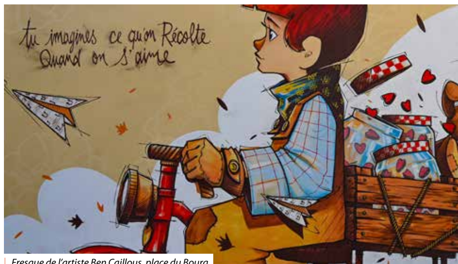
Fresque de l'artiste Ben Caillous, place du Bourg.