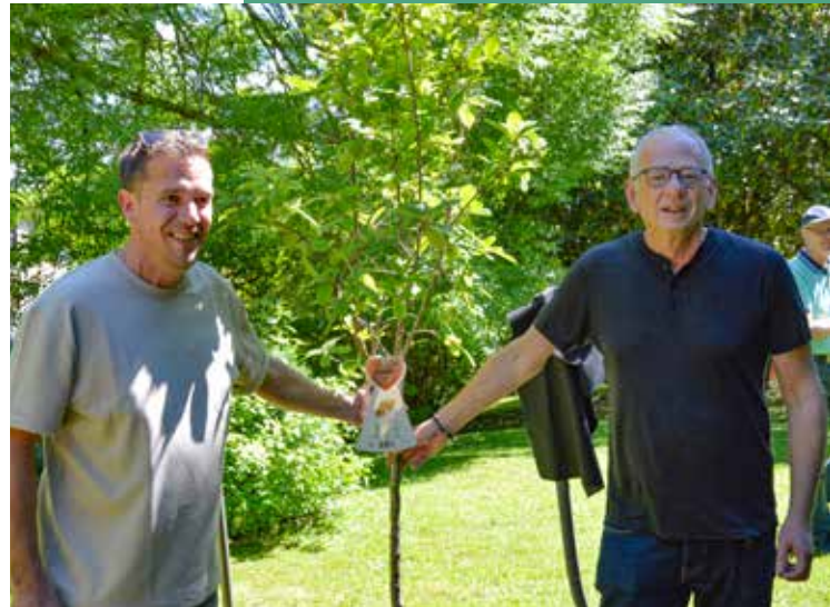
Plantation de l'arbre du cinquantenaire "Mespilus germanica" au parc Henry Dunant en mai 2024.

Chères amies, chers amis de La Motte-Servolex,