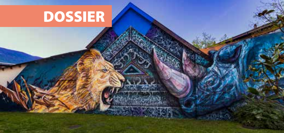
Fresque des artistes Cofee et Rino, au croisement des avenues Saint-Exupéry et Théodore Reinach.