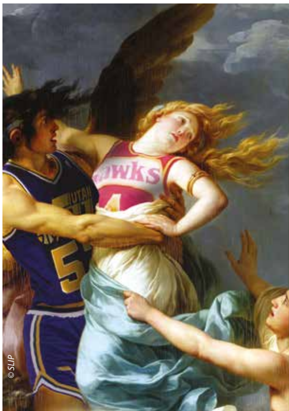
"Double Double" du 15 mai au 27 juin 2026 : collage, vidéo et installation sur le thème du sport.