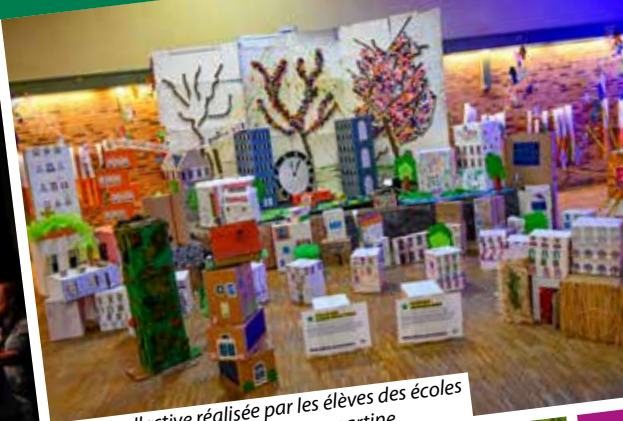
Œuvre collective réalisée par les élèves des écoles Louis Pergaud et Alphonse de Lamartine.