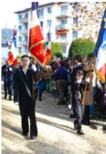
Cérémonies commémoratives du 11 novembre.