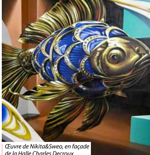
Œuvre de Nikita&Sweo, en façade de la Halle Charles Decroux.