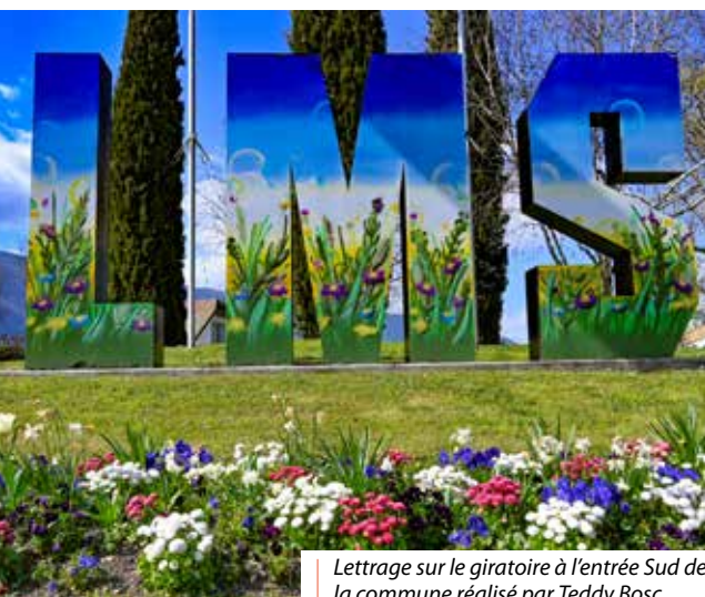
Lettrage sur le giratoire à l'entrée Sud de la commune réalisé par Teddy Bosc.