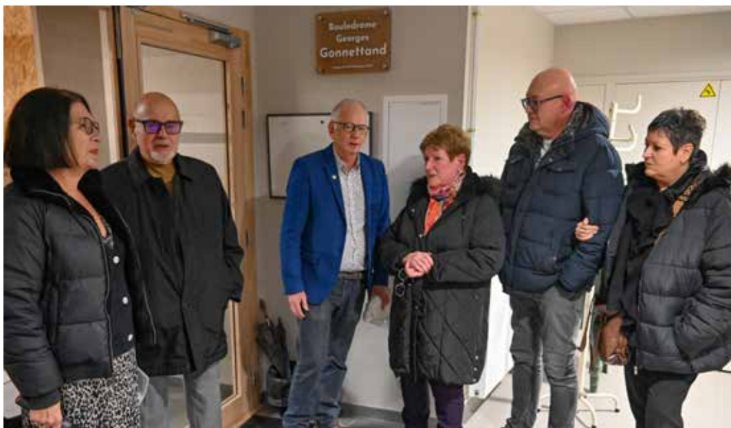
Après huit mois de chantier pour sa rénovation énergétique, les travaux du boulodrome ont été inaugurés le 28 novembre. La structure porte le nom de "Boulodrome Georges Gonnetand", en souvenir de l'homme arrivé en 1974 à La Motte-Servolex, sportif de haut niveau qui œuvra beaucoup pour le club, notamment par la création de l'école de boule ainsi que l'accueil du public scolaire.