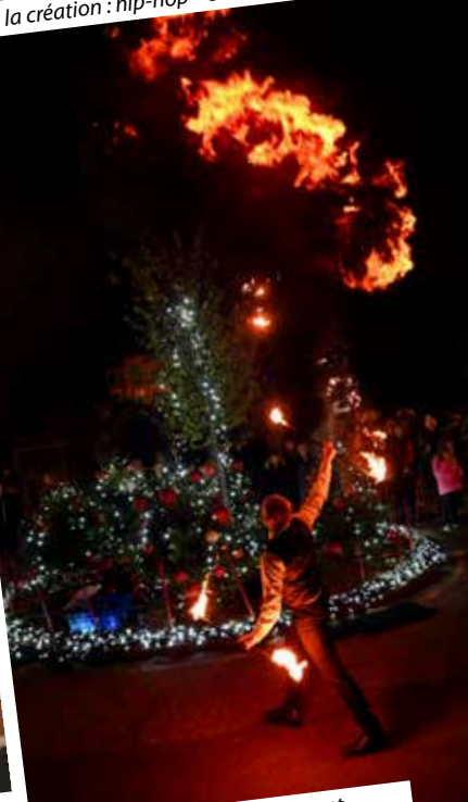
Marché du Père Noël : jongleurs et cracheurs de feu – Samedi 29 novembre.