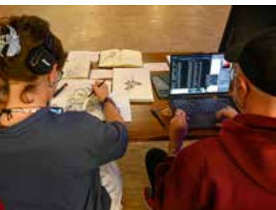
Nuit de la Création, pause créative avec l'atelier manga – Samedi 4 octobre.