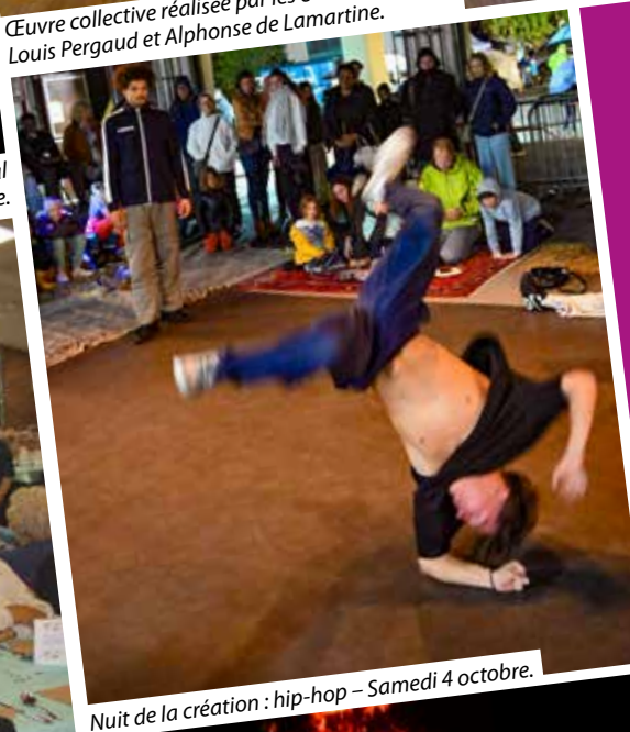
Nuit de la création : hip-hop – Samedi 4 octobre.