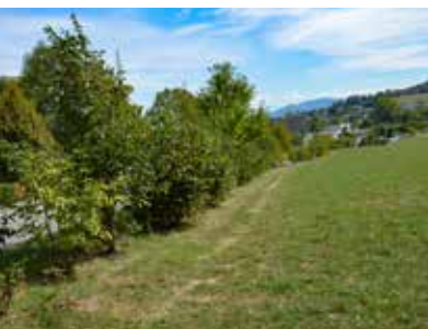
Biodiversité en centre-ville avec la plantation de six kilomètres de haies vives depuis 2015. Sur la photo : une belle évolution des arbustes avenue Charles de Gaulle.