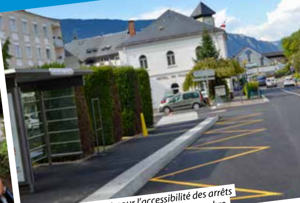
Nouvel aménagement pour l'accessibilité des arrêts de bus devant l'hôtel de ville – Jeudi 1 er septembre.