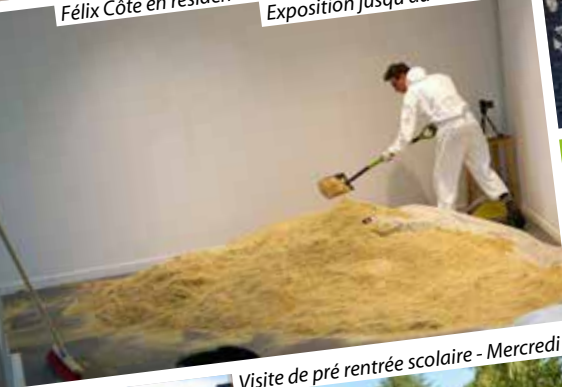
Visite de pré rentrée scolaire - Mercredi 31 août.