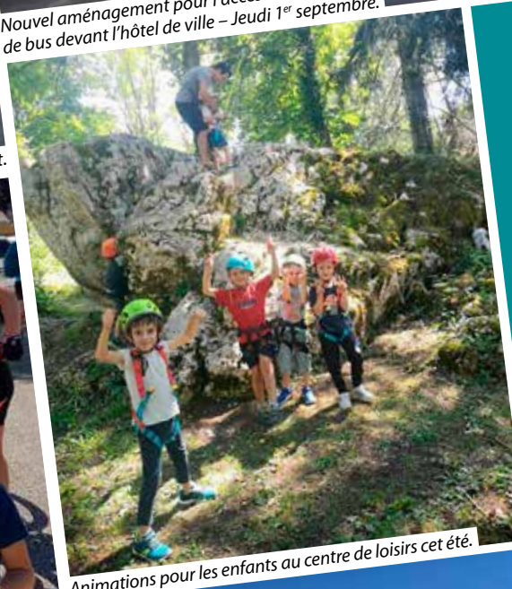
Animations pour les enfants au centre de loisirs cet été.