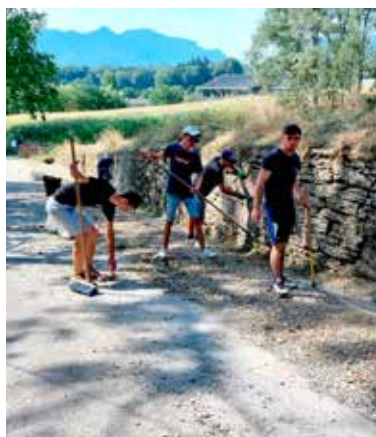
La ville a engagé différents "chantiers jeunes" en partenariat avec le service jeunesse cantonal : nettoyage du muret route du Noiray, réfection des peintures au local jeunes, désherbage manuel Clos des Perles et du Verger ainsi qu'au lavoir de Montaugier.