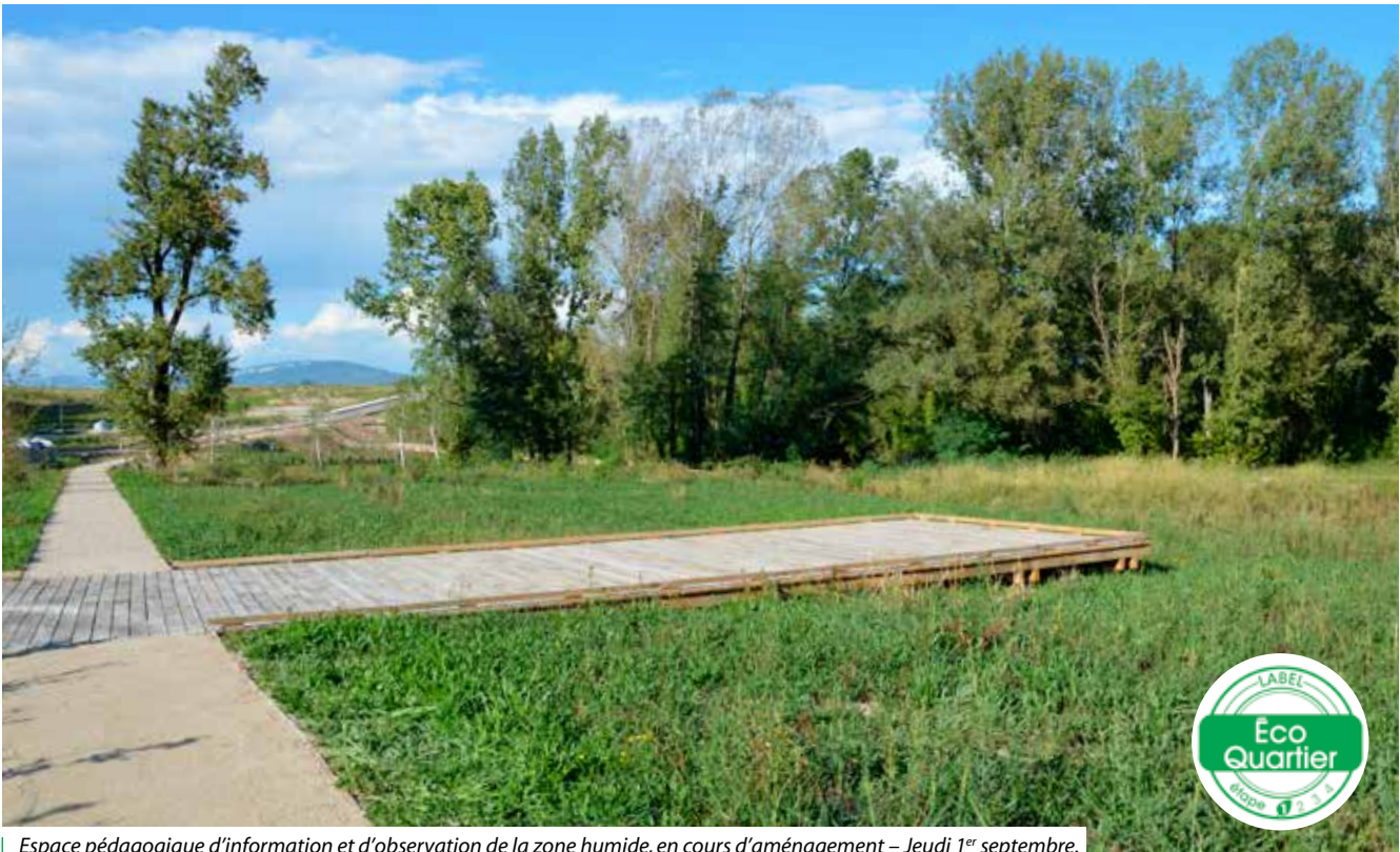
Espace pédagogique d'information et d'observation de la zone humide, en cours d'aménagement – Jeudi 1 er septembre.

Sur les dix sept hectares anciennement occupés par l'activité des carrières, l'éco hameau des Granges permet d'urbaniser sans consommer de terres agricoles, de réhabiliter une friche industrielle tout en valorisant la biodiversité menacée dans le secteur.