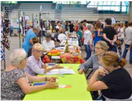
Journée des associations 3 septembre.