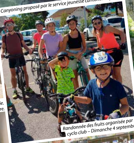
Randonnée des fruits organisée par le cyclo club – Dimanche 4 septembre.