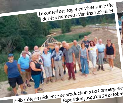
Le conseil des sages en visite sur le site de l'éco hameau - Vendredi 29 juillet.