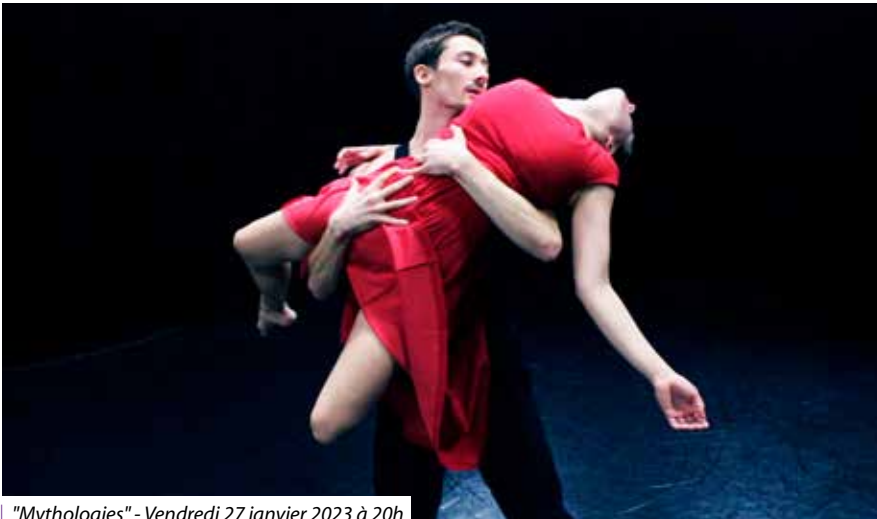
"Mythologies" - Vendredi 27 janvier 2023 à 20h