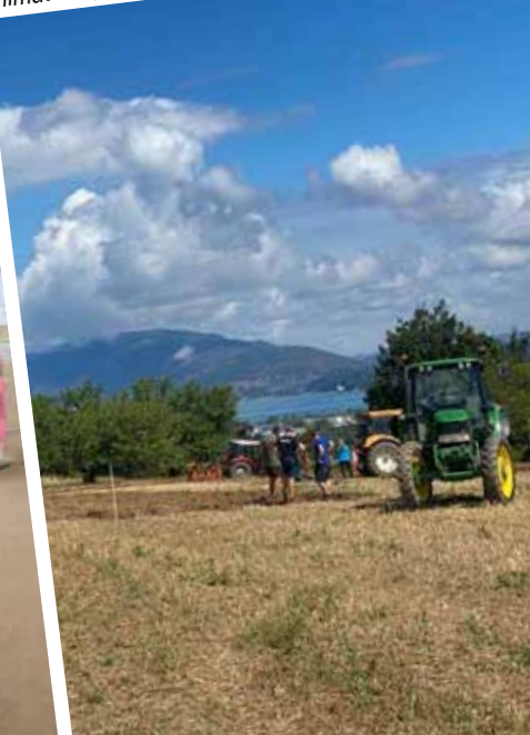
Concours départemental de labour organisé au Tremblay par les Jeunes Agriculteurs de Savoie Samedi 20 août.