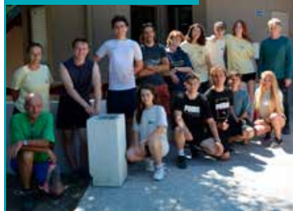
Les volontaires devant le Centre Communal d'Action Sociale.