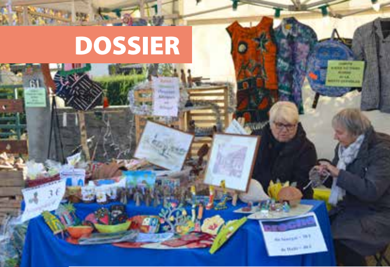
La ville propose gratuitement un espace aux associations motteraines de solidarité lors du marché du Père Noël, chaque année fin novembre.