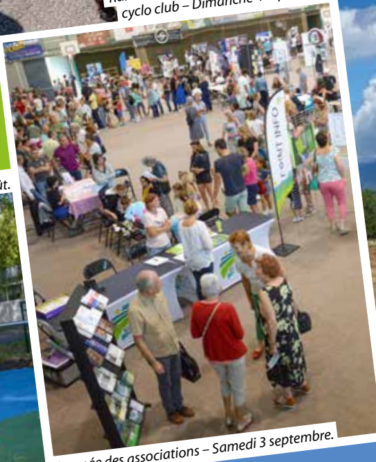
Journée des associations – Samedi 3 septembre.