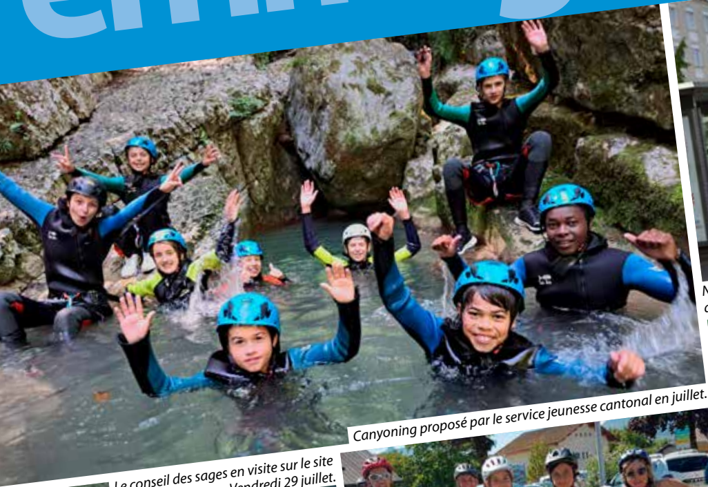
Canyoning proposé par le service jeunesse cantonal en juillet.