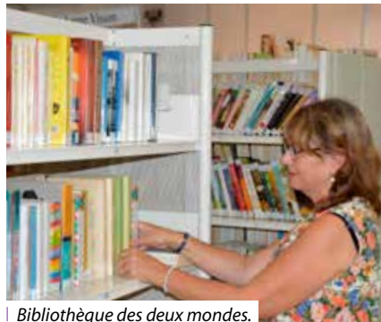
Bibliothèque des deux mondes.