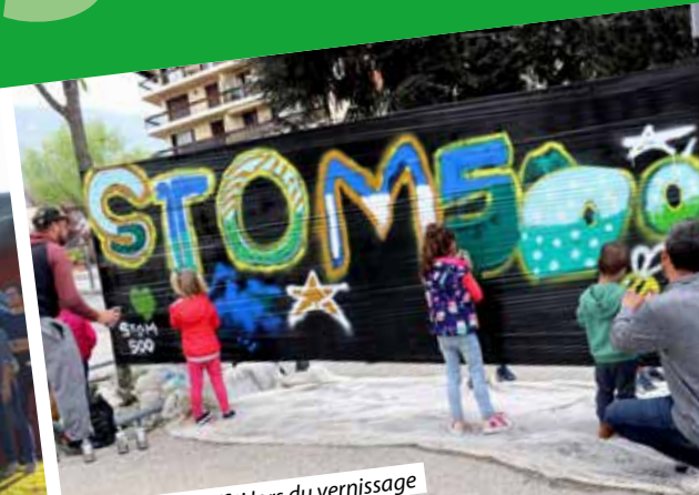
Initiation au graffiti lors du vernissage de l'œuvre de Stom 500 au M.U.R. Mardi 3 mai.