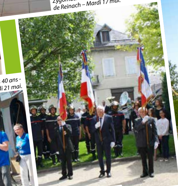
Commémoration du 8 mai 1945.