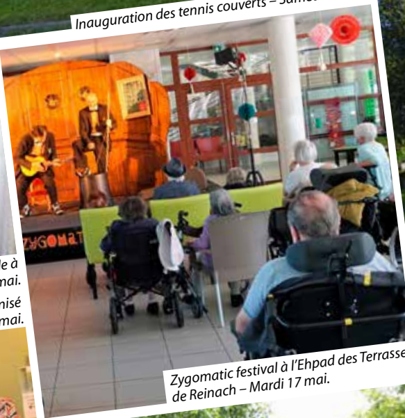
Zygomat festival à l'Ehpad des Terrasses de Reinach – Mardi 17 mai.