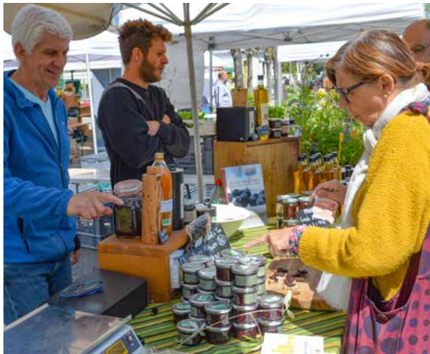
| Foire Bio des Savoie - Dimanche 1 er mai.