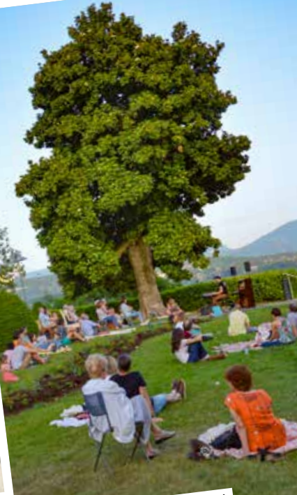
Soirée de la Villa, concert en plein air avec Skal – Samedi 21 mai.