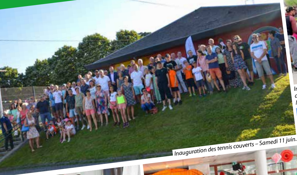
Inauguration des tennis couverts – Samedi 11 juin.