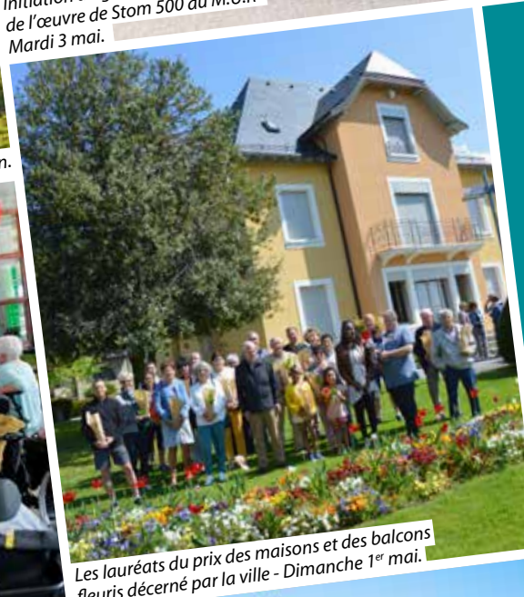
Les lauréats du prix des maisons et des balcons fleuris décerné par la ville - Dimanche 1 er mai.