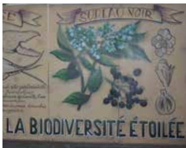
Fresque réalisée par le collectif de La Maise pour le lancement de la refonte de l'Atlas de la Biodiversité Communal. Samedi 26 mars.