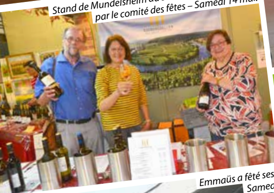
Emmaüs a fêté ses 40 ans - Samedi 21 mai.