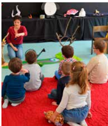
Séance de lecture lors des animations "Mon petit doigt m'a dit" sur le thème "Cette année c'est pas pareil" pour les enfants de 0 à 6 ans. Événement organisé par la Bibliothèque des deux mondes du 30 mars au 9 avril.