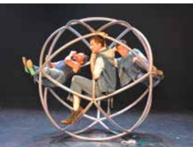
Spectacle "Z-D" par la compagnie Solfasirc – Vendredi 3 juin.