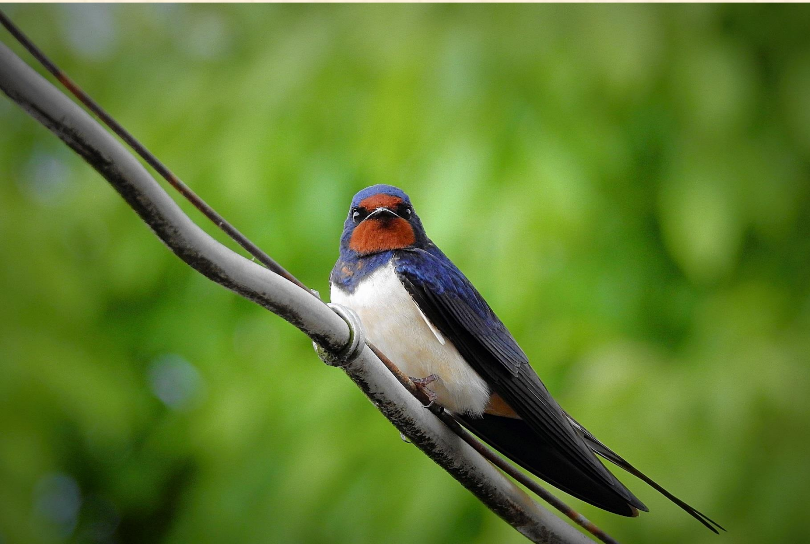
Hirondelle rustique (Hirundo rustica)